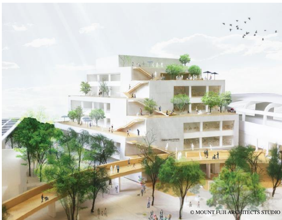
A3街区 外観イメージ

※街区名は、流山市の都市計画事業「新市街地地区一体型特定土地区画整理事業」によるものです。