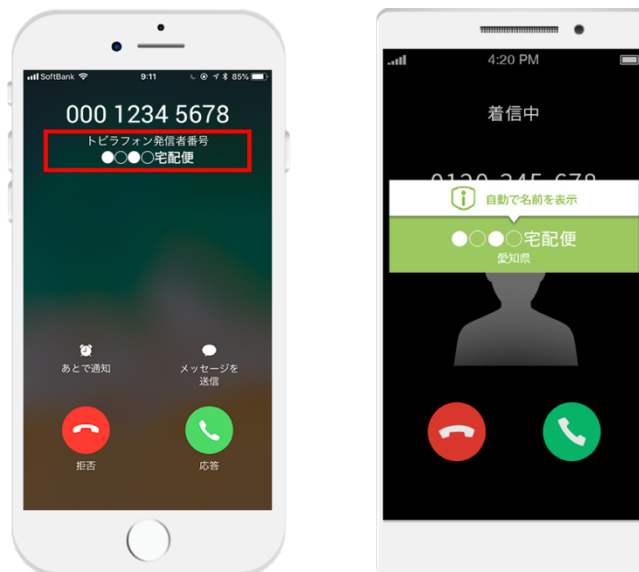
iPhone版 Android版 <事業者名称表示のイメージ>

当社の迷惑情報フィルターサービスご利用端末では、受発信時に当データベースを自動的に参照し、該当する発信先または発信元事業者名称を画面表示いたします。