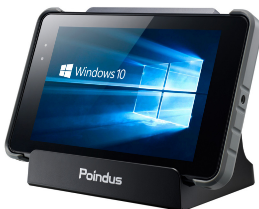
導入予定のタブレット機器 (タブレット)