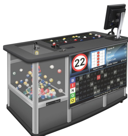
導入予定のビンゴ機器 (ブローラ及び制御盤)