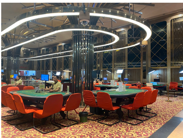
ビンゴ会場を設営予定の Roxy Casino 内ホール